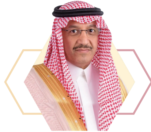
معالي وزير التعليم يوسف بن عبدالله البنيان راعي المؤتمر