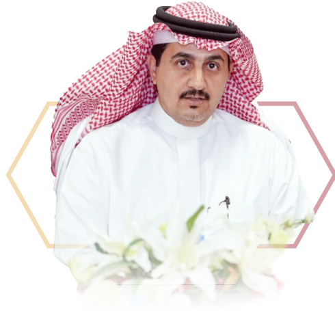
سعادة رئيس الجامعة أ.د. صالح بن عبدالله المزعل رئيس المؤتمر